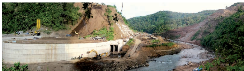
Vy över den pågående byggnationen av Titab Dam.