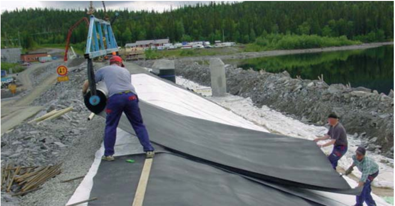
Utläggning av geomembran