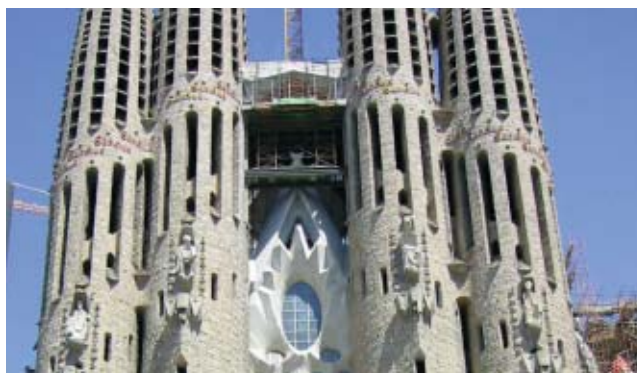
Katedralen La Sagrada Familia

Närmare upplysning om ämnena och instruktioner